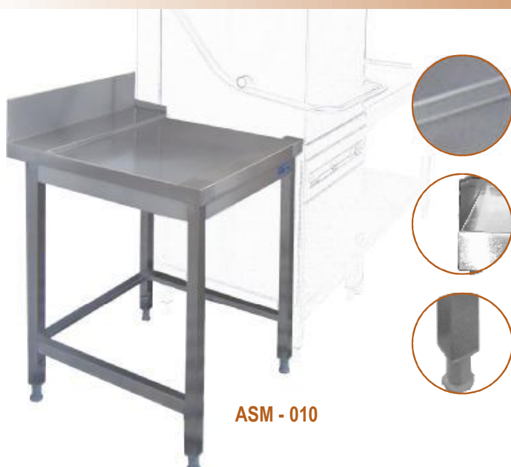
ASM - 010